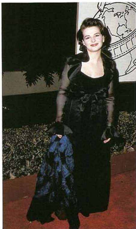
L'actrice Juliette Binoche.